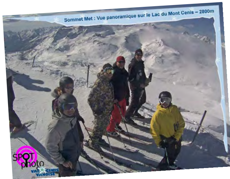
photo Hotspot Wifi per fare cartoline digitale sulle piste